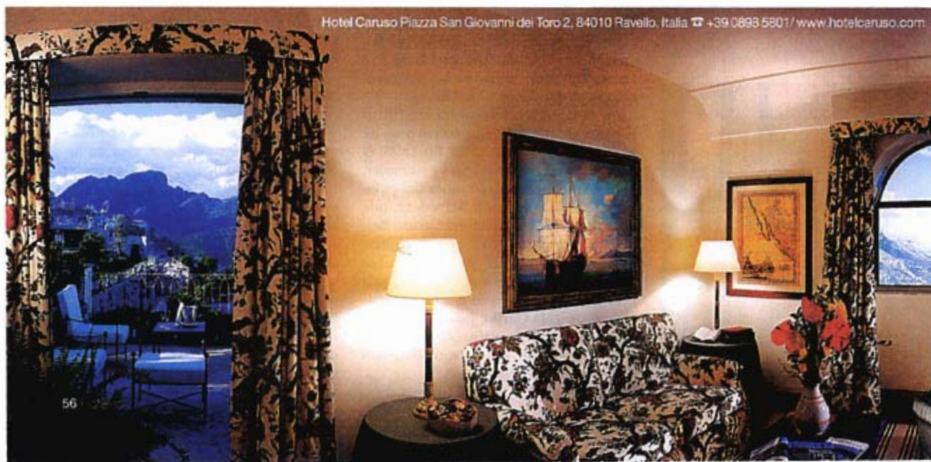
Hotel Caruso Piazza San Giovanni del Toro 2, 84010 Ravello, Italia ☎ +39 0898 5801 / www.hotelcaruso.com